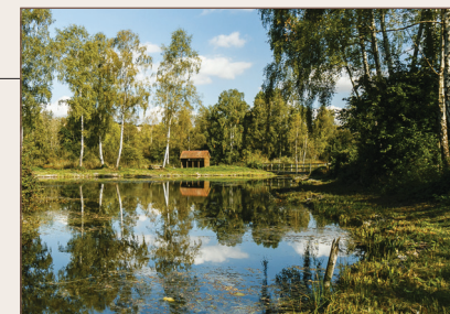
Marais de Génonville

Venez découvrir un espace naturel de 40 hectares dans un méandre de l'Avre, à Moreuil. Un sentier vous permettra d'observer toute la flore et la faune de ce marais. Le site compte de nombreuses espèces rares et/ou menacées, dont 16 protégées et comporte aussi dans les oiseaux, des espèces rares, menacés au niveau national, des insectes rares comme le Lycaena dispar . Tout au long de votre promenade, vous croiserez de nombreux panneaux explicatifs. L'activité d'extraction de la tourbe du XII e siècle jusqu'à l'entre-deux guerres, est à l'origine de ces étangs.