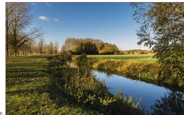
Le long de l'Avre