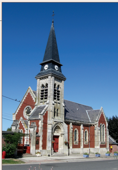
Église de Braches

C'est dans l'Oise, à Amy, petit village situé à 7 km de Roye, que l'Avre prend sa source. Les eaux descendant des collines encadrant son lit étroit augmentent son débit, elle entre dans le département de la Somme à Roiglise, et y longe le marais, mais ne s'y mêle pas. Sur son parcours, elle reçoit plusieurs affluents, d'importances variables. Après le ruisseau Saint-Firmin à Roye, les trois Doms la rejoignent à Pierrepont-sur-Avre. La Luce s'y jette à son tour à Berteaucourt-les-Thennes. C'est ensuite la Braches qui les rejoignent à Braches et pour finir la Noye à Boves. Après avoir calmement serpenté sur quelque soixante kilomètres et agrémenté les paysages de son bassin (1 150 km 2 ), la rivière se jette dans la Somme à Camon