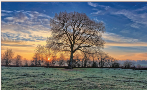
Matin d'hiver au bord de l'Avre

s'achever dans celle de la Canche. Il s'étire sur 220 km du GR® 12A dans l'Oise au GR® 121 dans le Pas-de-Calais.