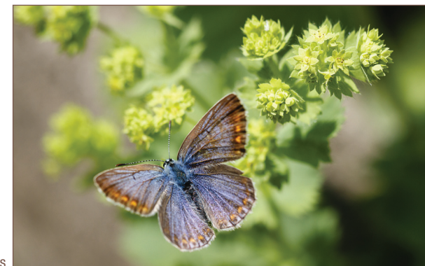
Argus sur de l'alchémille mollis

• Comité Somme : https://somme.ffrandonnee.fr • Rando Aventure http://randoaventuremoreuil.e-monsite.com/