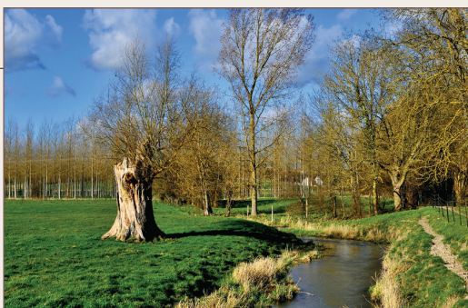
La Luce à Démuin

Jaillissant naguère à Caix, la source de la Luce, bien que toujours présente mais plus sous le lit de la rivière qu'apparente, ne sort vraiment de terre maintenant qu'à quelques kilomètres en aval, à Cayeux-en-Santerre. Entre ce village et celui d'Ignaucourt, elle reçoit l'eau de son affluent « l'Équipée » tandis que celle d'un second dit « la Margot » s'y jette au pont de Courcelles, près d'Aubercourt. Après